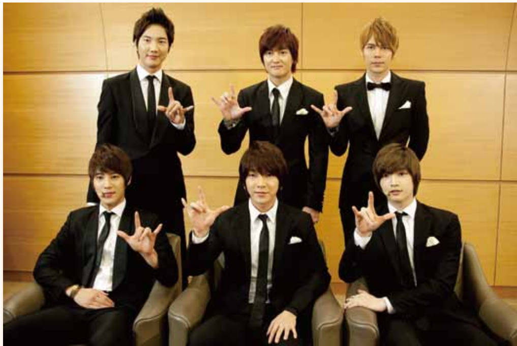
超新星 LIVE TOUR2011 <Make it> in 福岡