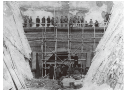
畑のトンネル開削記念 (明治44年頃)

草に覆われて忘れ去られようとしているトンネルですが、飯能市を代表する貴重な近代化遺産の一つです。(柳戸 参考文献) 埼玉県立博物館編「埼玉県の近代化遺産」(1996年 埼玉県教育委員会)