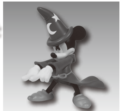
ヴァイナルコレクティブドールズ No.31 ミッキーマウス (ミッキーマウス魔法使いの弟子) サイズ:全高約170mm 【メディコム・トイ】 ©Disney ©Walt Disney Company. All Rights Reserved.