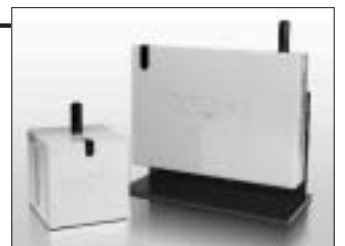
緊急地震速報端末