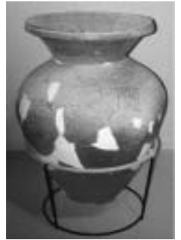
新井原遺跡出土 須恵器甕 (常設展示室) おそらく加治丘陵の窯で焼かれたものと思われます。

飯能市域での時代毎の遺跡分布を見ますと、古墳時代にはあまり遺跡が見られません。しかし奈良時代になりますと、精明地区を流れる南小畦川流域に遺跡が連なり、加治地区では湧水の場所に遺跡が現れます。これらの遺跡は、高麗郡が設置されたことによりつくられた集落の跡と考えられます。移住してきた人々は、高麗郡の名が示すとおり、朝鮮半島の北半部にあった高句麗からの渡来系の人々であったことが、『続日本紀』という歴史書に記されており、当時高い技術をもった技術者集団であったといえましょう。