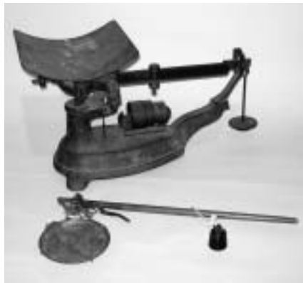
うわざらさおばり さおばり 上皿棹秤 (奥) と 棹秤 (手前)

重さを測る最初の道具は「天秤」で、古代エジプトの壁画などにも描かれています。天秤は精度が高いため、主に両替商で使われたほか、医師の薬や金細工師の金を測るために使われました。次に登場したのが「棹秤」です。これはテコの原理を応用した秤で、棹に吊るした錘を動かし、釣り合ったところで重さを測るものです。天秤は多くの錘が必要ですが、棹秤は錘1つである一定の重さまで測ることができるため、持ち運びに便利で、様々な用途に使われました。