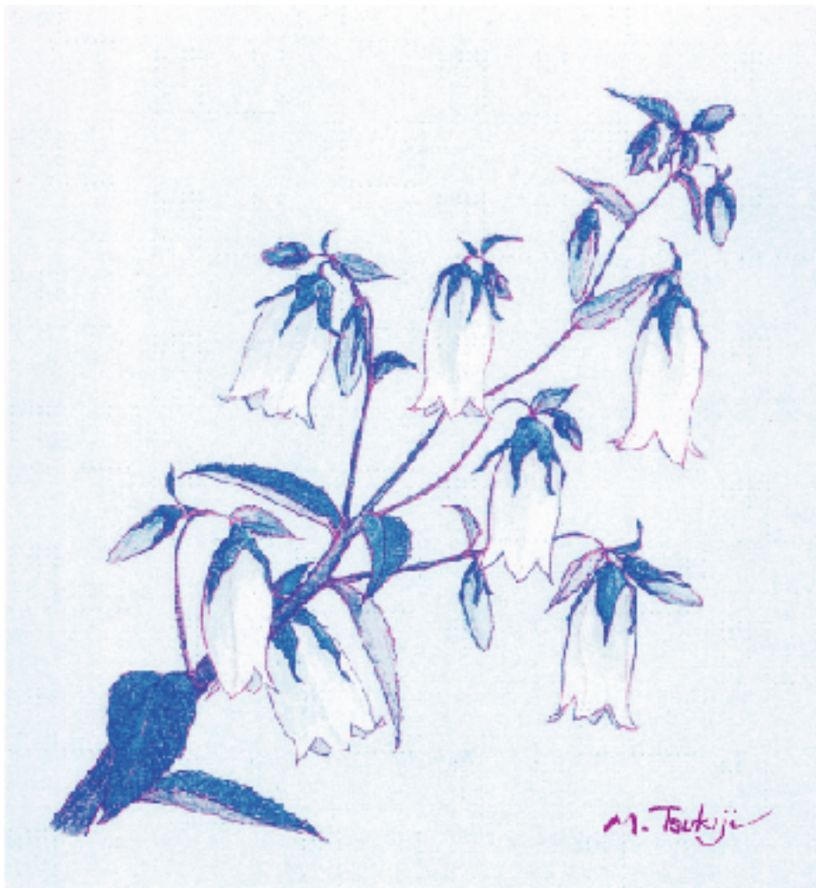
画 / 築地美恵子