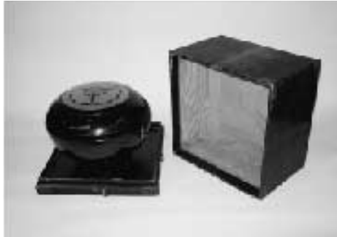
漆塗り蓋付鉢とその箱(当館蔵)

この鉢が飯能で使われていたのか、実際にどう使われていたのかなど詳細は分かりません。また「漆塗り蓋付鉢」と書きましたが、どう呼ばれていたのかも不明です。知っているという方がいらっしゃいましたら郷土館までご連絡ください。(A)