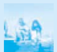
しあわせ家族計画 © 松竹 男はつらいよ 真次郎忘れな草 © 松竹