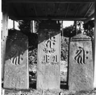
加治家季供養のために建てられた板碑(左) 現在は智観寺の収納庫に納められている。

中山の智観寺には今から760年前の仁治3(1242)年の板碑(写真)があります。これは、元久2(1205)年に鎌倉幕府軍とその有力御家人であった畠山重忠が二俣川(現在の横浜市)で合戦になった時に討ち死にした加治家季を供養するために、その子が立てたものです。加治家季は飯能市の東の方を根拠地にしていた武士で、この時は安達景盛の指揮下に入っていました。現在NHKの大河ドラマ『北条時宗』で柳葉敏郎さんが扮する安達泰盛は、この景盛の孫にあたります。(〇)